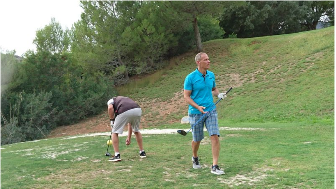
Golf Son Terme