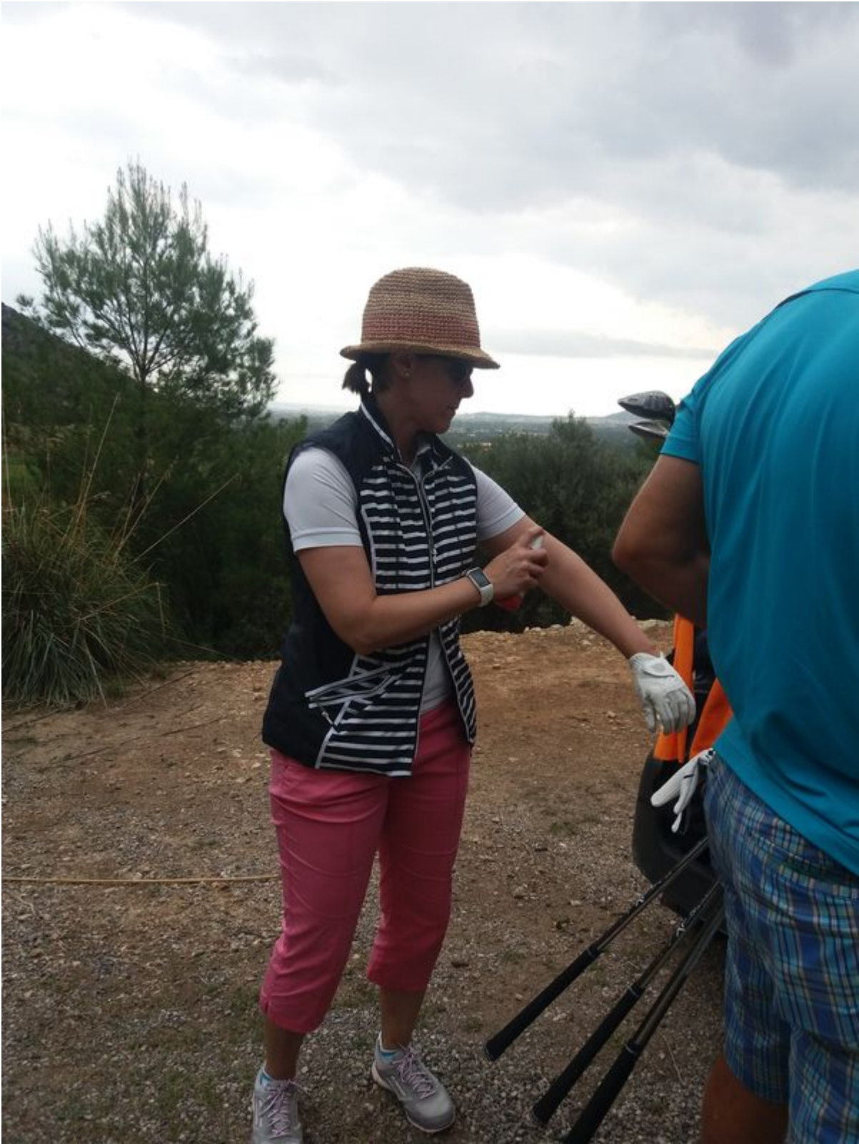
Golf Son Terme