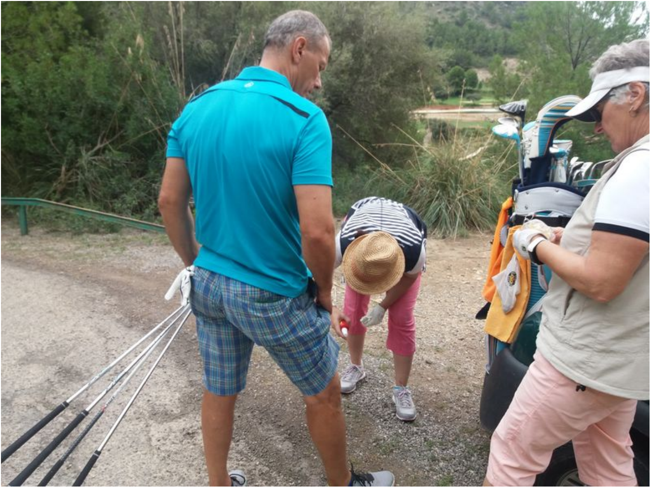
Golf Son Terme