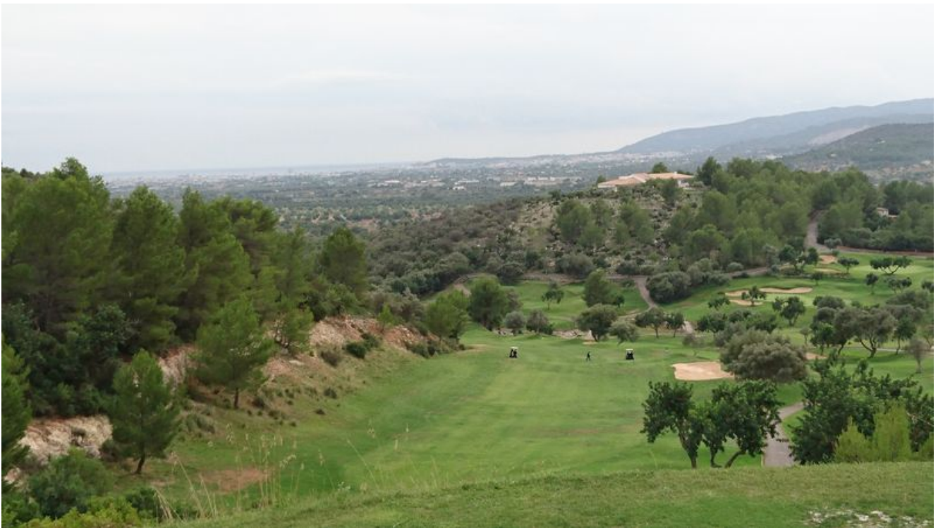
Golf Son Terme