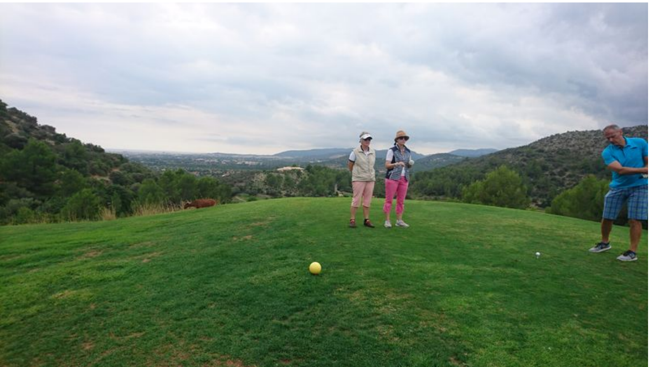
Golf Son Terme