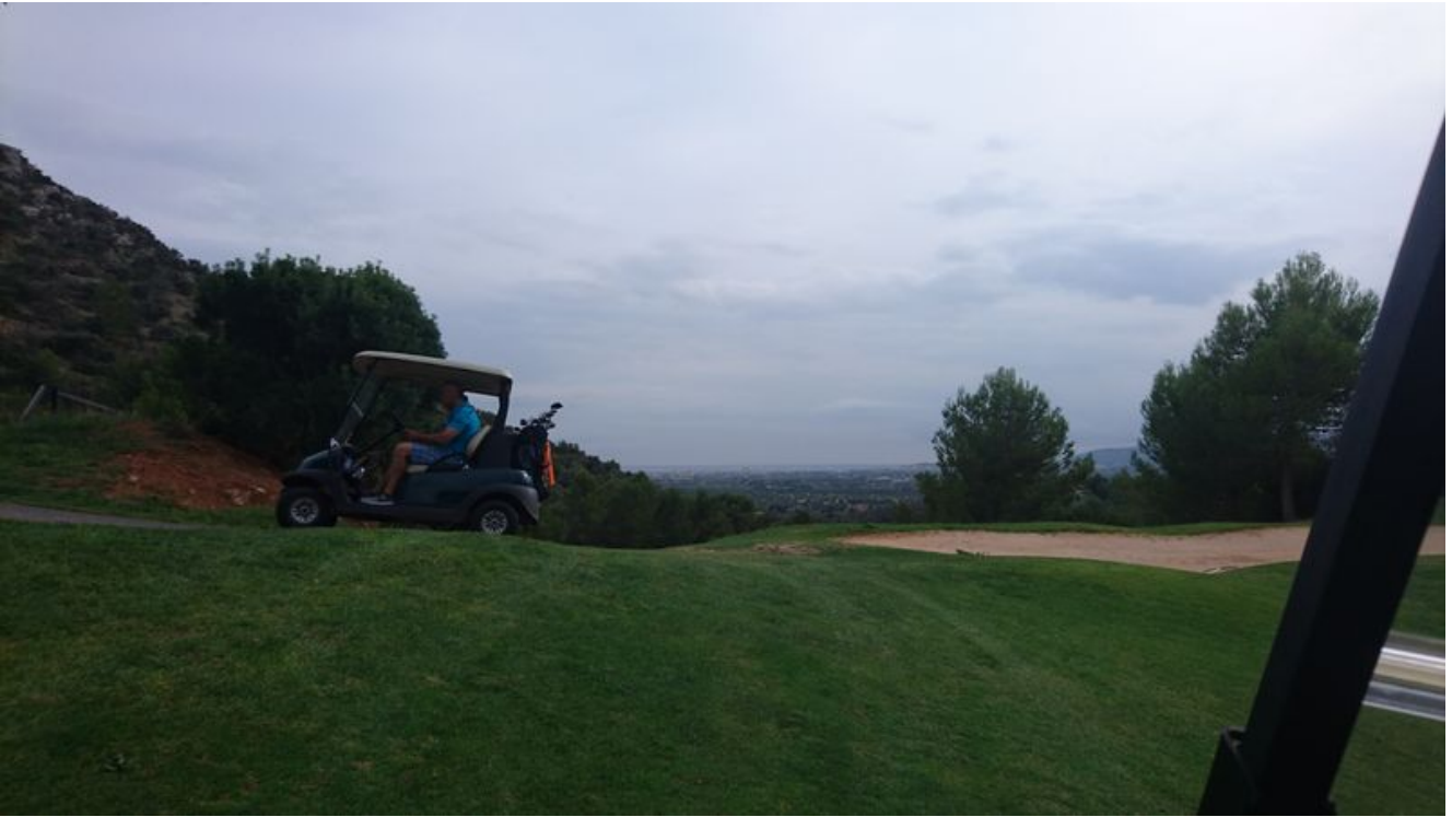
Golf Son Terme